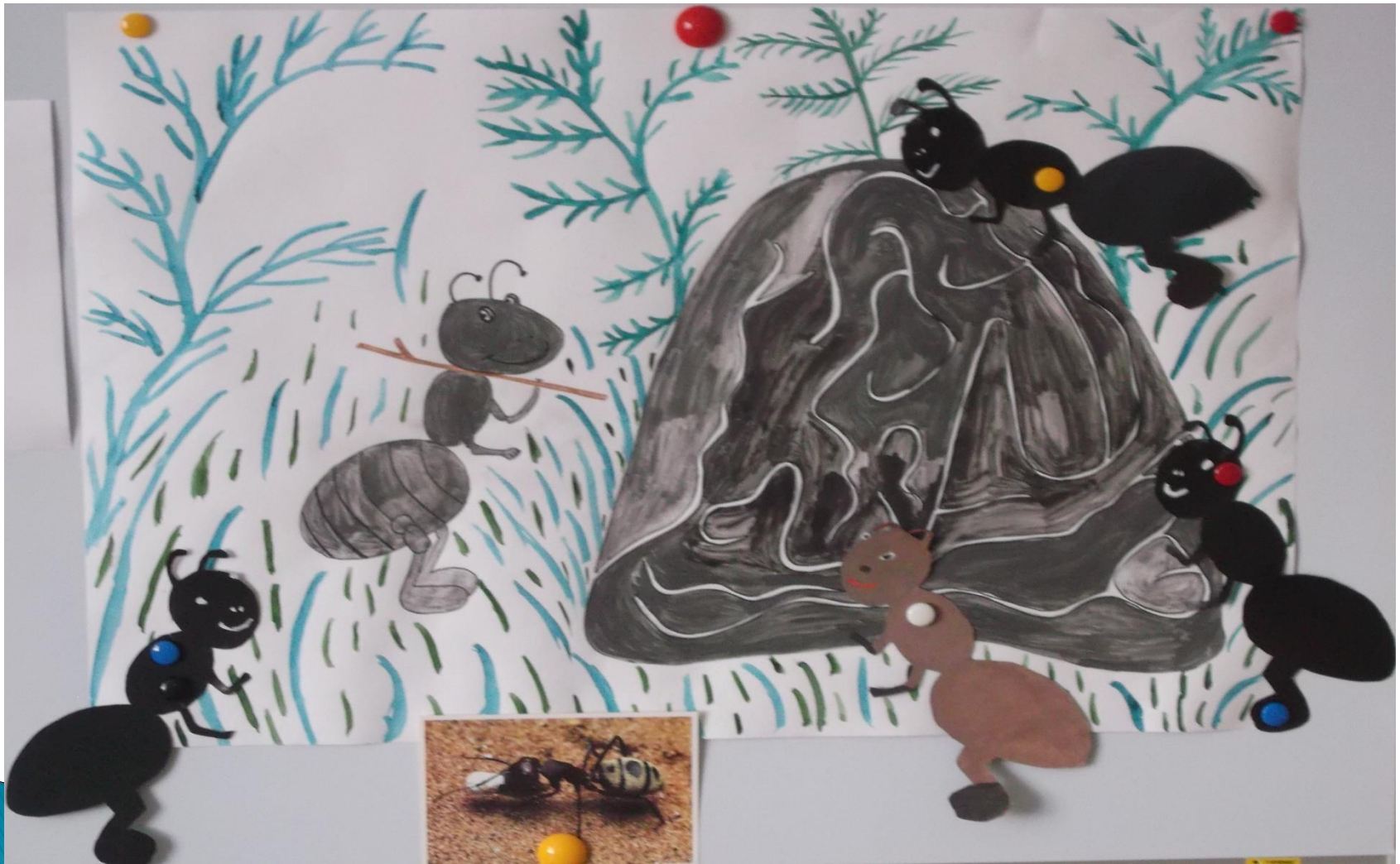
Схема муравейника в разрезе